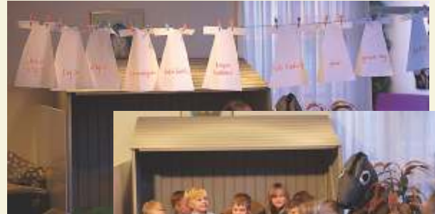
Julnattsgudstjänst 24 december