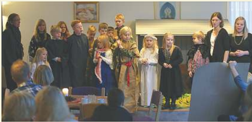
Söndagsskolans julfest 14 december