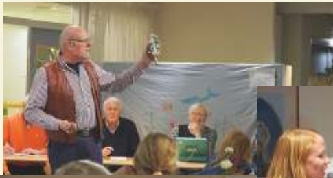
Missionsauktion 15 november