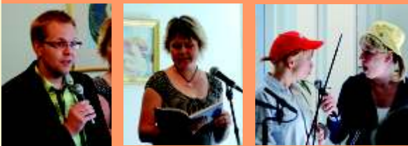
Familjegudstjänst 10 maj med Småbarnsmusiken och Söndagsskolan