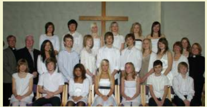
Konfirmation 17 maj med 20 konfirmander